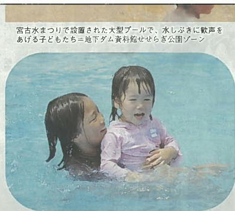
宮古水まつりで設置された大型プールで、水しぶきに歓声をあげる子どもたち＝地下ダム資料館せせらぎ公園ゾーン