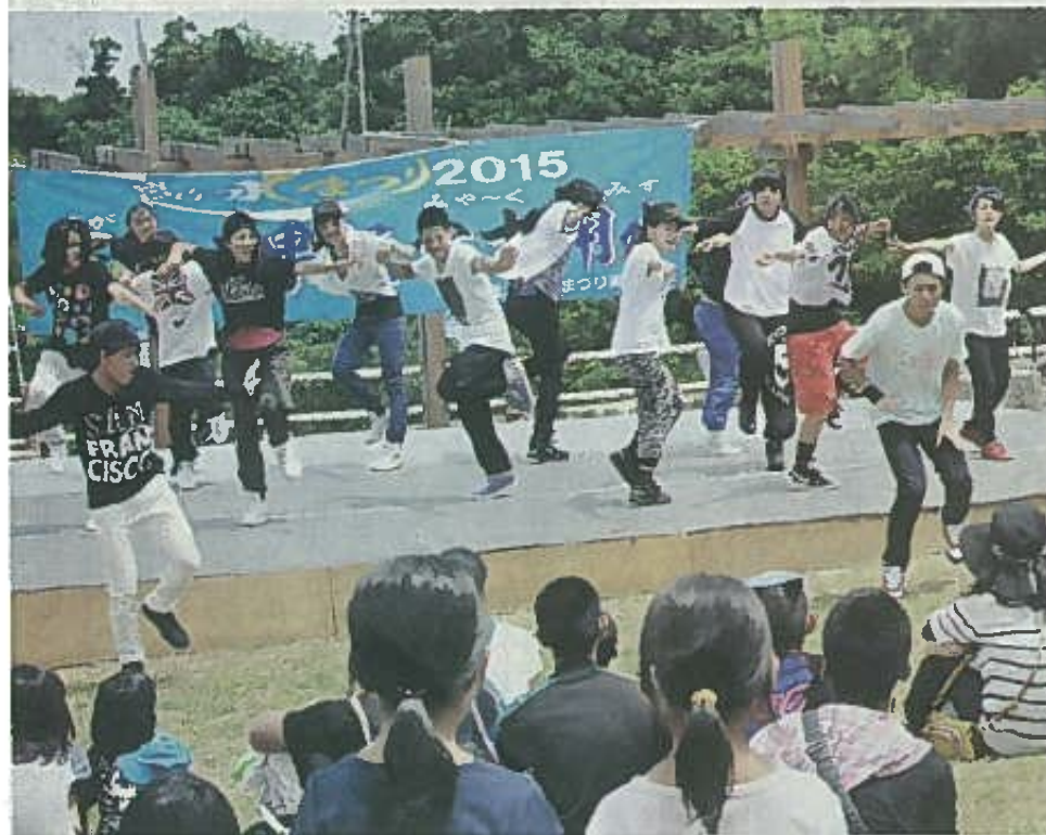
賑やかなヒップホップダンスで盛り上げた宮古高校ダンス部