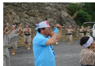
関係者のテープカット・クイチャーでまつりは開幕した