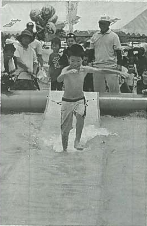
水上に張ったゴザの上を走りタイムを競うなど、多彩なイベントで楽しんだ宮古水まつり2015＝28日、地下ダム資料館周辺

第6回目となる宮古水まつり2015（主催・同実行委員会）が28日、城辺福東の地下ダム監視施設前広場などで開催された。「黄金（くがに） 世果報（ゆがふ） 宮古用水（みやーくぬみず）」のテーマのもと、水の恩恵に感謝し、農業水利施設の重要性を次世代に継承しようとする水にまつわる様々なイベントやステージアトラクションなどが展開され、会場に詰めかけた大勢の市民や観光客らが歓声をあげながら楽しいひと時を過ごしていた。（3面に写真特集）