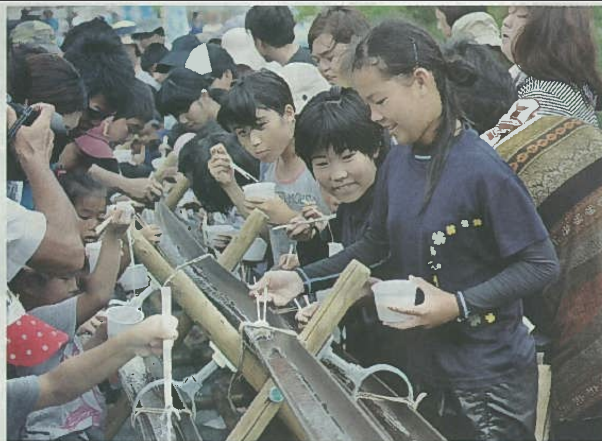
長さ約30mのそうめん流しでは、老若男女が参加しておいしく楽しんだ