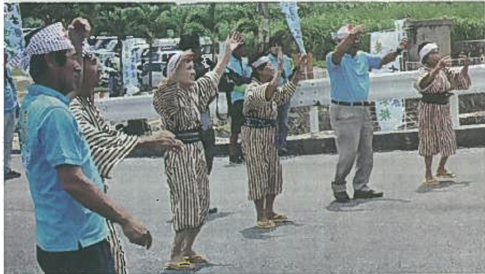
オープニングセレモニーで、福里クイチャーを踊る保存会のメンバーと実行委員ら