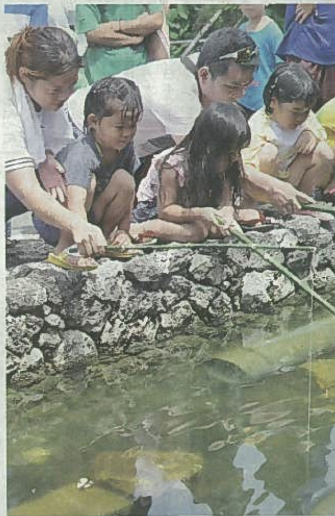
ザリガニ釣り大会で、真剣な表情でザリガニを狙う親子ら