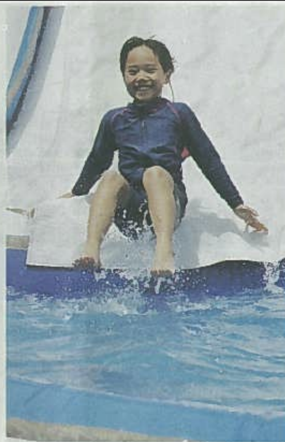
ウォータースライダーで、笑顔で水に飛び込んでいく女の子