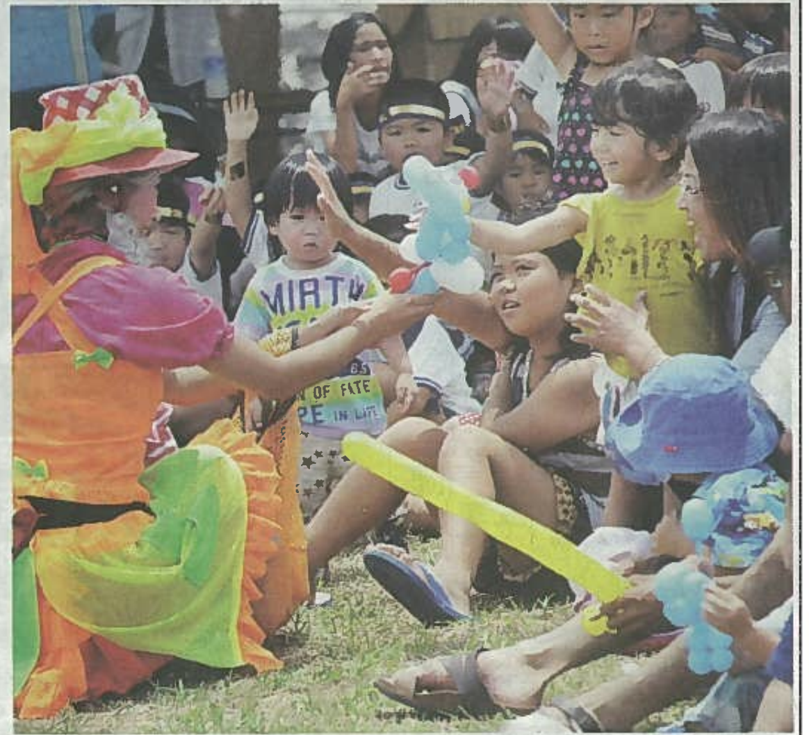
マジックバルーンショーで、島ビエロのゆずちゃんから風船の人形をもらって笑顔を見せる女の子