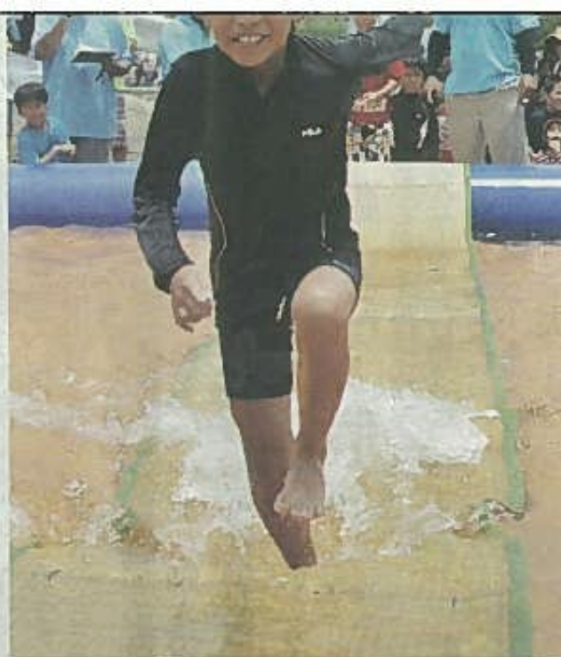
水上ゴザ走り競走で、見事な走りを見せる男の子