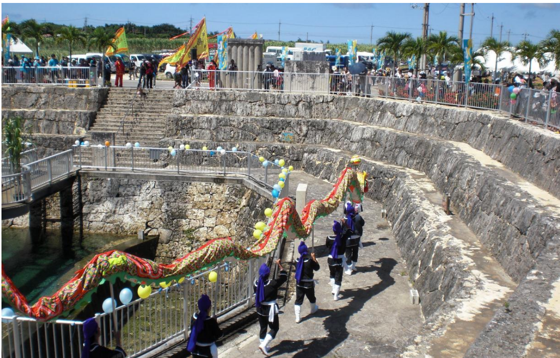
地下ダム管理施設における宮古龍獅団による龍踊りの演武