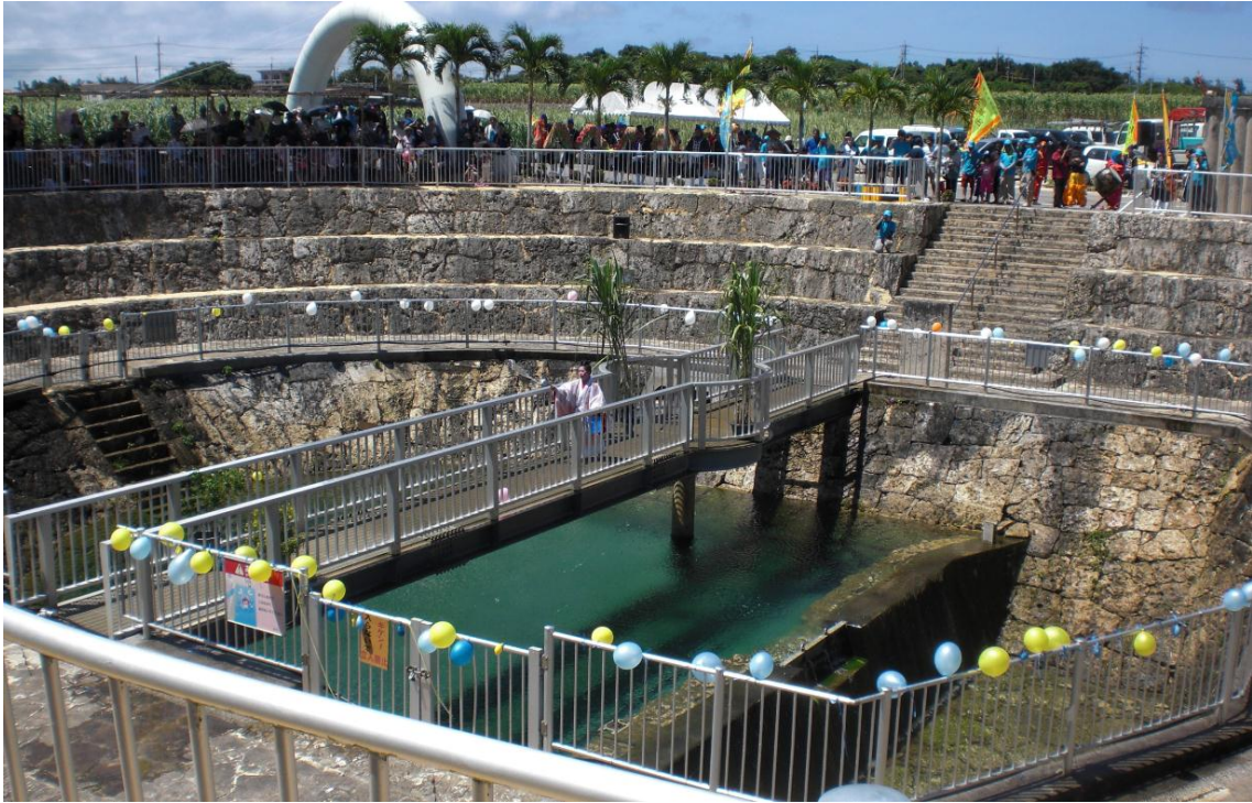
昔ながらの雨乞いの儀式の再現