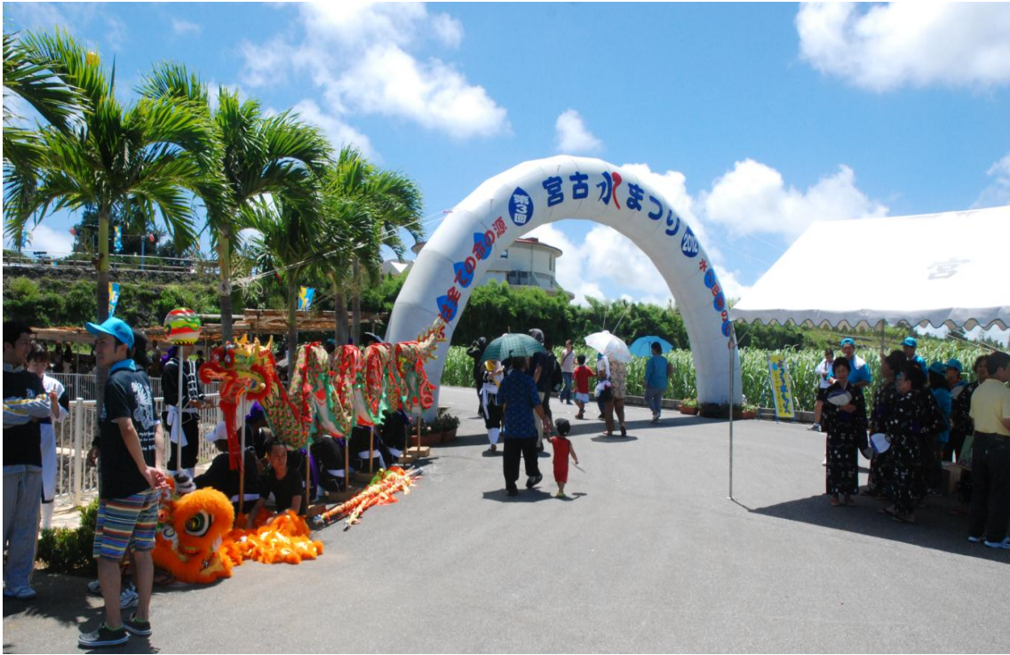
まつり会場入り口付近