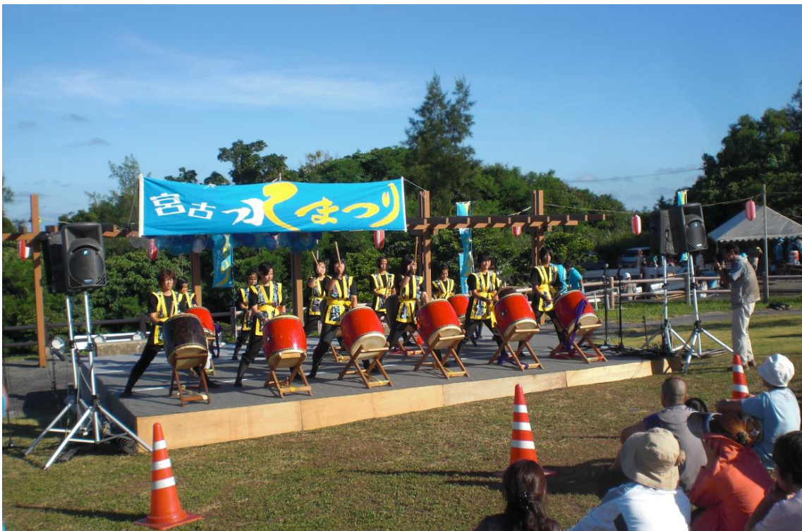
イベント会場における地元小中学生（新風太鼓）による太鼓の演武