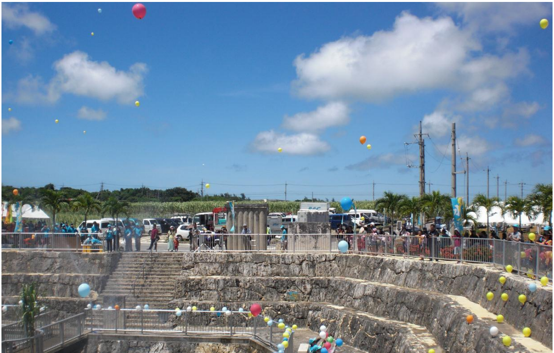
開会宣言後、緑肥となるひまわりの種を入れた風船を放ち、豊作を祈願した