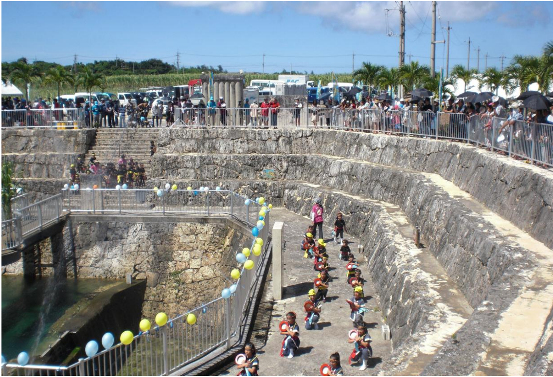
地元子供会（ちびっこらんど）によるエイサーの演武